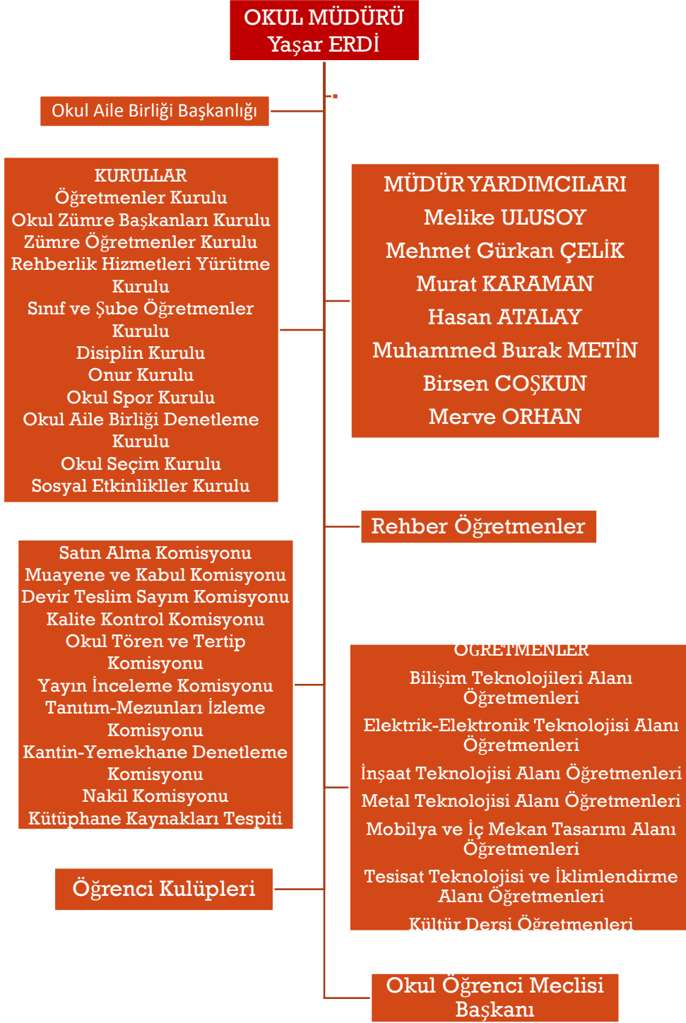
Şekil 2. Organizasyon Şeması